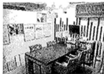
▲打ち合わせスペースには自然素材が展示されている